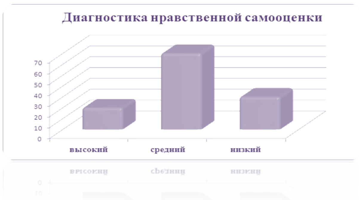
Диаграмма 1 – Уровни нравственной самооценки

Результаты диагностики нравственной самооценки следующие: высокий – 20 %, средний – 70 %, низкий – 30 % (диаграмма 1).